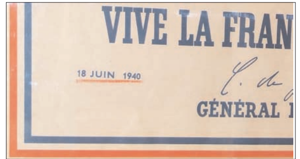
Affiche dite « Appel du 18 juin », imprimée en France, 1944

Le texte de l'affiche ne doit pas, non plus, être confondu avec l'appel radiophonique prononcé le 18 juin 1940, qui n'a pas été enregistré par la B.B.C. comme ce fut le cas pour l'appel du 22 juin.